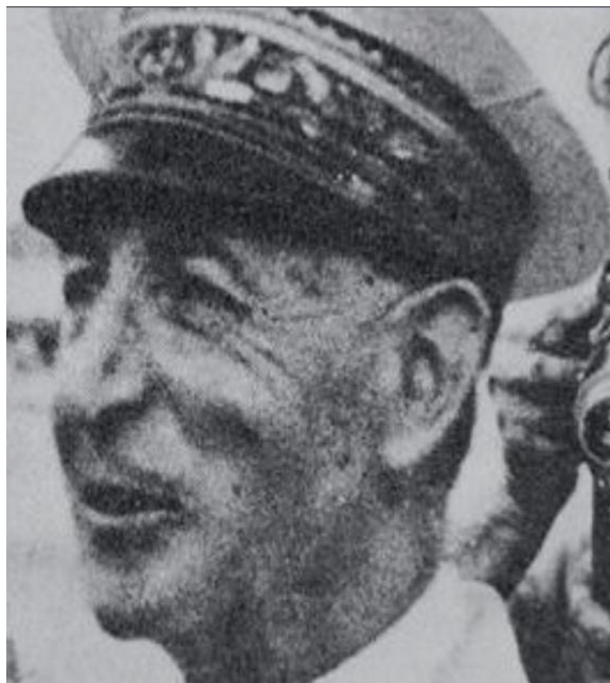
Cao Ủy D'ARGENLIEU