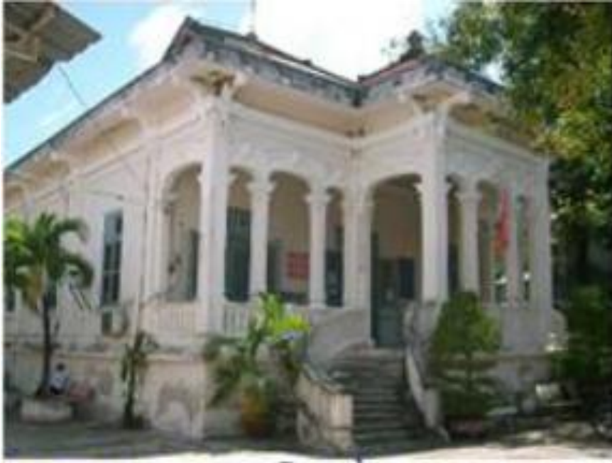
Nhà của Ông KÝ GIỎI - Bạc Liêu.

(Nơi Đức Thầy cư ngụ từ ngày 13-6-1941 (19-5 Tân Ty) đến ngày 10/10/1942 (1-9 Nhâm Ngũ). Tổng cộng 485 ngày.