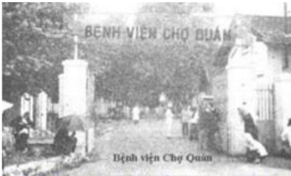
Bệnh viện CHỢ QUÁN - Saigon. Nơi Đức Thầy bị quản thúc 308 ngày, từ ngày 7-8-1940 (4-7 Canh Thìn).