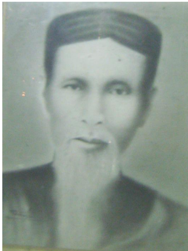
Ông CHỦ PHỐI