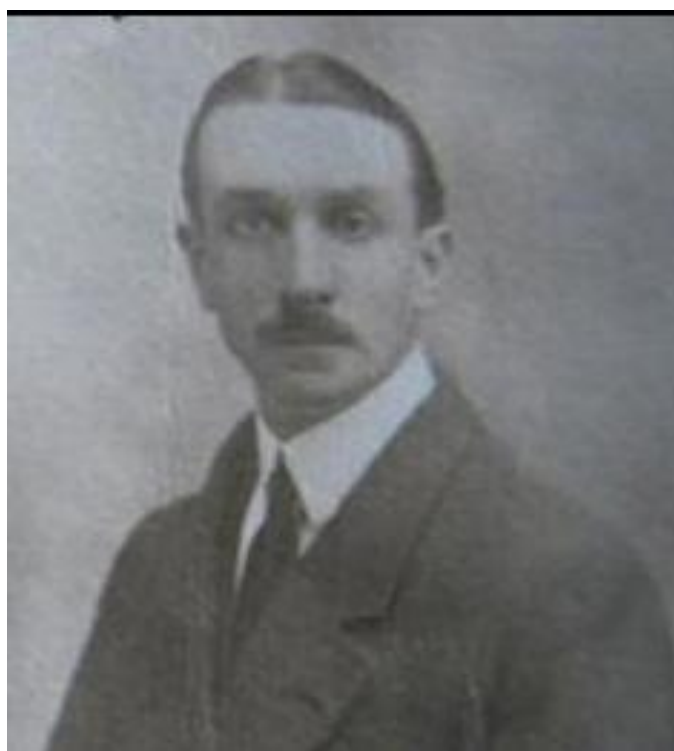
ĐỜ-CU (Jean Decoux)