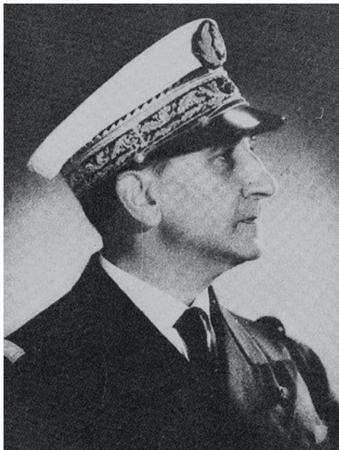
ẠC- NÚC (ARNOUT)