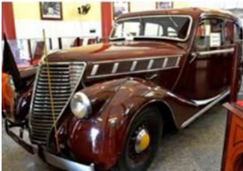
Xe chở Đức Thầy đi Khuyến nông