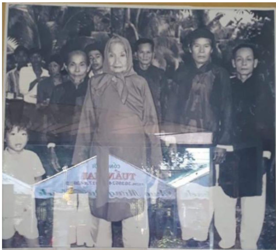
BÀ KÝ GIỎI và đồng đạo PGHH